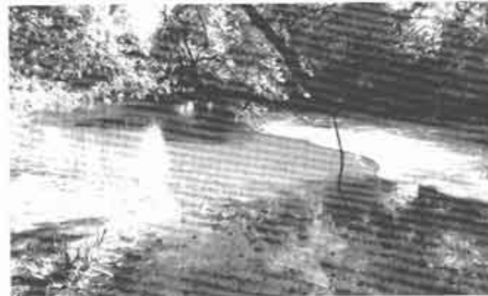
La nature a son état sauvage protégé.

Sur une surface de 22,6 ha, avec vingt-trois habitats, et mille espèces inventoriées, la réserve naturelle régionale du bocage des Antonins constitue un îlot paysager représentatif de la Gâtine Armoricaïne. Elle est la première réserve mise en place sur un espace bocager avec le maintien d'un pastoralisme extensif.