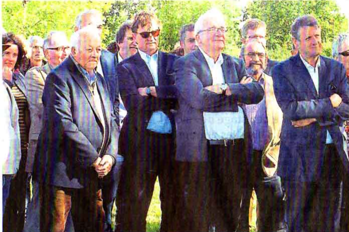
Les personnalités présentes à l'inauguration de la Réserve naturelle régionale du bocage des Antonins.

Le bocage autour de l'étang de Forges, à Saint-Marc-la-Lande, constitue un îlot paysager représentatif de la Gâtine armoricaine. Près de 23 hectares de prairies sont comptabilisés, 8 km de haies, un étang et sept mares. Le tout en très bon état de conservation, favorisant une grande biodiversité. 320 plantes ont été recensées, dont des espèces protégées. En ce qui concerne la faune, pas moins de 500 espèces ont été inventoriées, dont certaines