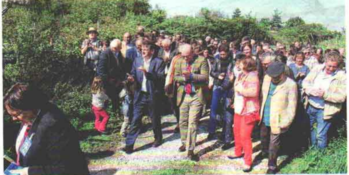
... ce qui lui a permis d'échapper à cette horde d'humains en balade.