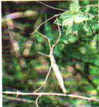
Ce phasme s'était réfugié sur une branche haute d'un talus...

Il y avait bien trop d'humains, hier, dans la nouvelle réserve naturelle régionale de Saint-Marc-la-Lande. Mais pour une bonne cause : son inauguration.