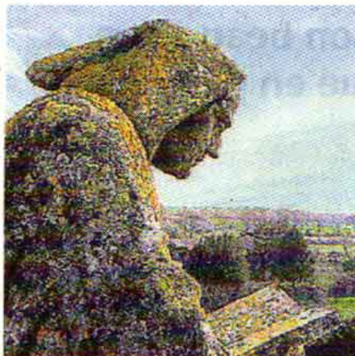
La réserve des Antonins inaugurée le 26 septembre.

Renseignements : Deux-Sèvres Nature Environnement, tél. 05 49 73 37 36, contact.dsne@ yahoo.fr