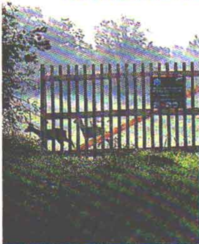
Une multitude de milieux sur environ 23 hectares.

Participants, agriculteurs, habitants de longue date et chasseurs ont pu exprimer leurs points de