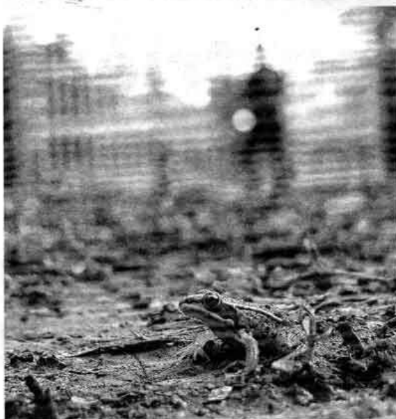
De très nombreuses espèces vivent sur le site.