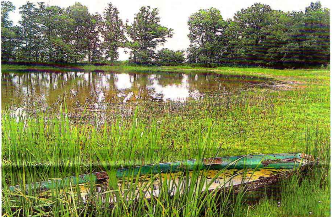
Un écriin bocager de 22 hectares préservé grâce à l'intérêt que lui ont porté propriétaires et exploitants successifs.

La première réserve naturelle régionale est en Deux-Sèvres, plus précisément à Saint-Marc-la-Lande.