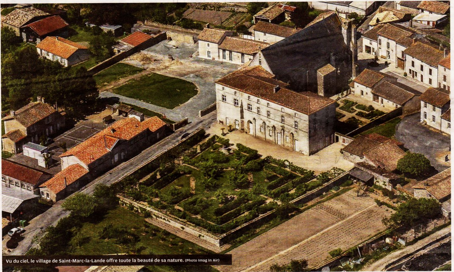
Vu du ciel, le village de Saint-Marc-la-Lande offre toute la beauté de sa nature.