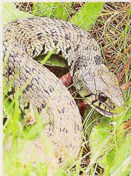
Le groupe a pu observer une couleuvre à collier.

Moncoutant ; rendez-vous à 9 heures, au parking de l'église.